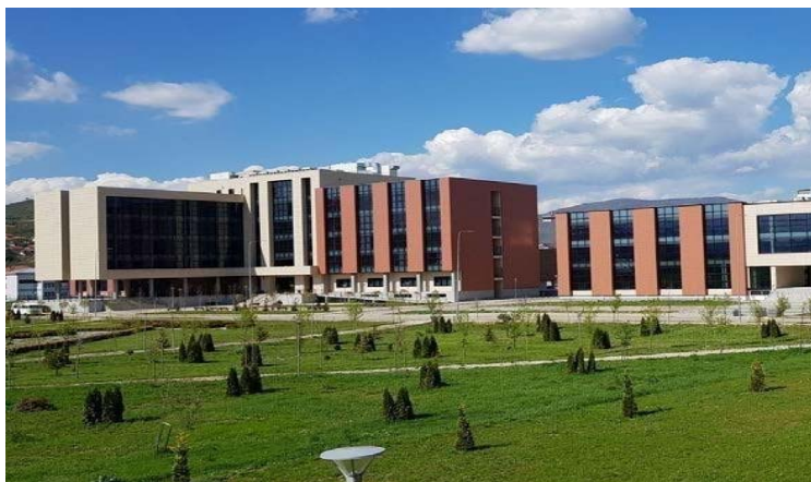
Objekti ku zhvillon veprimtarinë FTU

Aktivitetet e fakultetit përfshijnë arsimin e lartë, ofrimin e studime bachelor dhe master në programet e studimit Inxhinieri dhe Teknologji Ushqimore si dhe Teknologji me specializimet Inxhinieri Kimike dhe Inxhinieri e Mbrojtjes së Mjedisit po ashtu edhe kërkimet shkencore në fushat përkatëse.